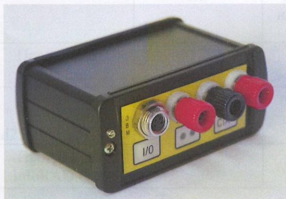
Рисунок 1 – Регистратор автономный РАД-256М

Внешний вид регистратора и обозначение места для размещения знака утверждения типа представлены на рисунках 1 и 2.