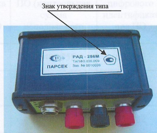
Рисунок 2 – Размещение знака утверждения типа